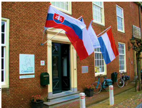
Ingang Comenius Museum

In het begin van de 20 e eeuw werd in de voormalige Waalse Kapel van Naarden een mausoleum ingericht voor Jan Amos Comenius (1592-1670). De filosoof Comenius was in zijn vaderland Bohemen, maar ook ver daarbuiten, een bekende figuur. Er zijn, ook in Nederland, verschillende scholen en straten naar hem genoemd. 40 Elk jaar wordt hij in Naarden op zijn sterfdag, 15 november 1670, herdacht met een kranslegging door de ambassadeurs van de Tsjechische en van de Slowaakse republiek. In het naastgelegen gebouw aan de Kloosterstraat is het Nederlandse Comenius Museum gevestigd. Beide, mausoleum en museum, trekken jaarlijks vele bezoekers, zowel uit ons land als uit Tsjechie en Slowakije en andere landen.